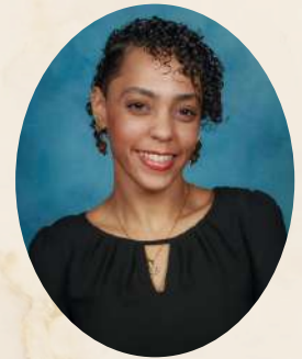
Ms. Denisse Coordinadora de Padres

¡ESPERO TRABAJAR CONTIGO DURANTE TODO EL AÑO ESCOLAR!